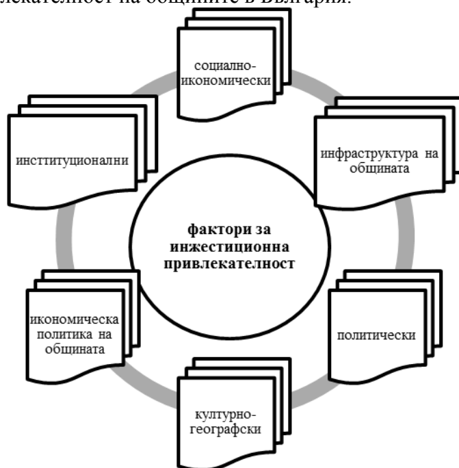
Фиг. 1. Модел на факторите, определящи инвестиционната привлекателност на общините

На фиг.1 е показано предложение за групиране на факторите за определяне инвестиционната привлекателност на общините в България.